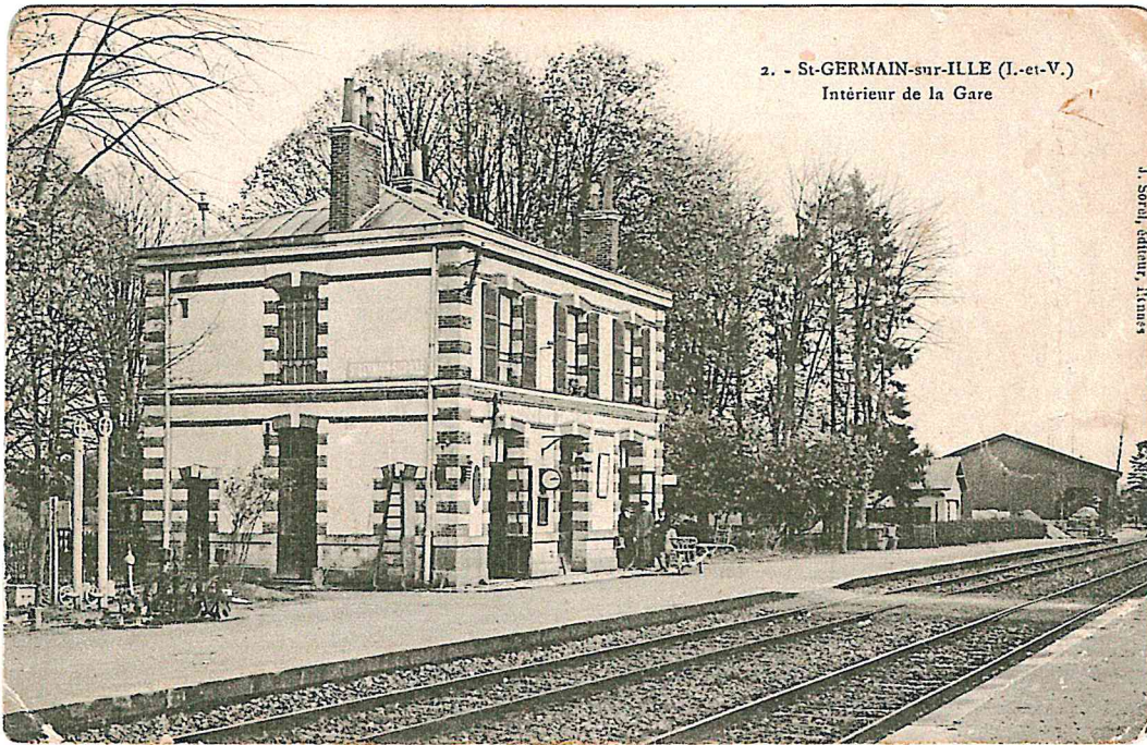
J. Sorel, éditeur, Rennes